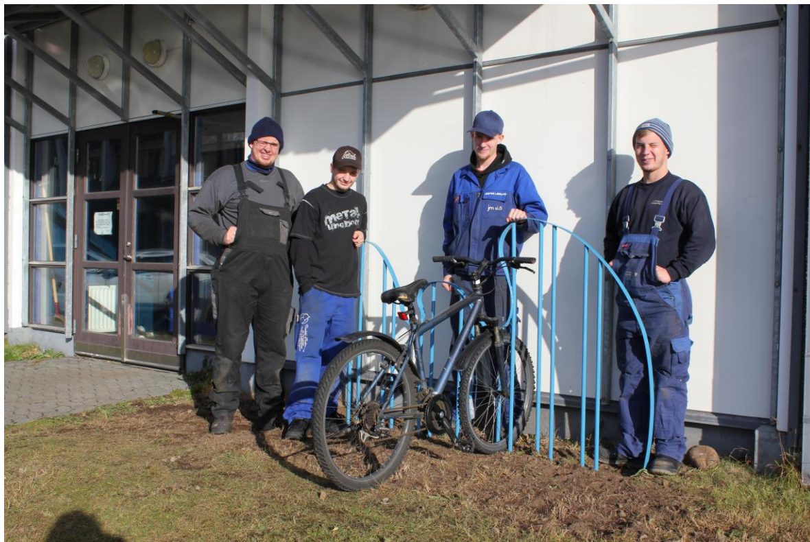
Dönsku nemendurnir við reiðhjólstand sem þeir smíðuðu fyrir skólann

Leonardo da Vinci. Í maí 2011 undirritaði MÍ og danskur verknámsskóli, EUC Lillebælt í Fredericia, samstarfssamning um nemendaskipti í verknámsgreinum. Fjórir nemendur í á lokaári í málmíðngreinum og vélvirkjun komu frá danska skólanum og dvöldu í skólanum í sex vikur á haustönn. Stefnt er að því að fjórir nemendur í málmsmíði í MÍ dvelji við EUC Lillebælt næsta haust.