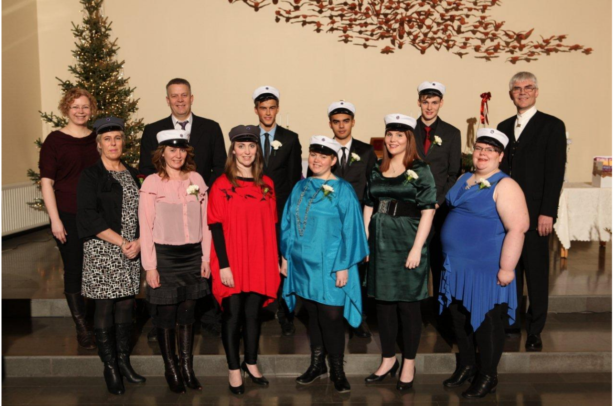
Útskriftarnemar ásamt stjórnendum skólans í Ísafjarðarkirkju laugardaginn 17. desember