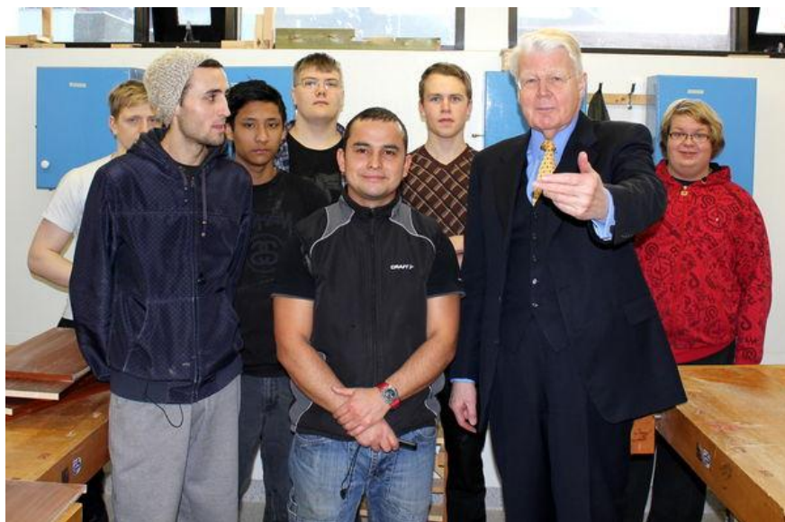
Forseti Íslands, Ólafur Ragnar Grímsson ásamt nemendum í hússasmíði.

Forseti Íslands, Ólafur Ragnar Grímsson heimsótti skólann í byrjun nóvember. Í fylgd með forsetanum voru forsetaritari og fulltrúar frá samtökum iðnaðarins. Tilgangur heimsóknarinnar var fyrst og fremst að ræða við nemendur og starfsfólk um tengsl náms og atvinnulífs og þau fjölbreyttu störf sem standa til boða í hinum ýmsu greinum iðnaðar. Forsetinn ávarpaði nemendur og vakti meðal annars athygli á mikilvægi verknáms og að skil á milli þess og bóknáms væru of mikil. Gestirnir lýstu ánægju sinni með það gróskumikla starf sem fram fer í skólanum og þau miklu og góðu tengsl sem skólinn hefur við atvinnulíf og fyrirtæki í bænum.