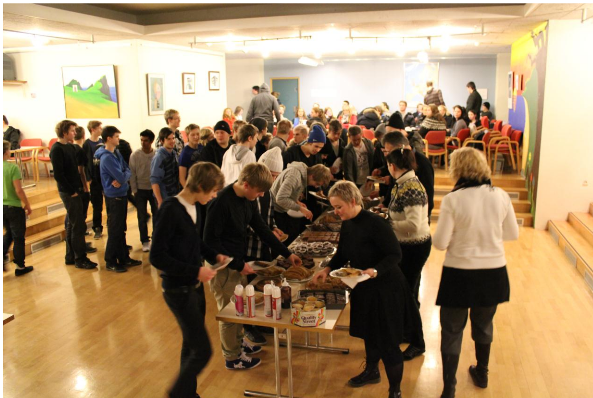
Sólarkaffi 27. janúar í boði skólans og 3ja árs nemenda.