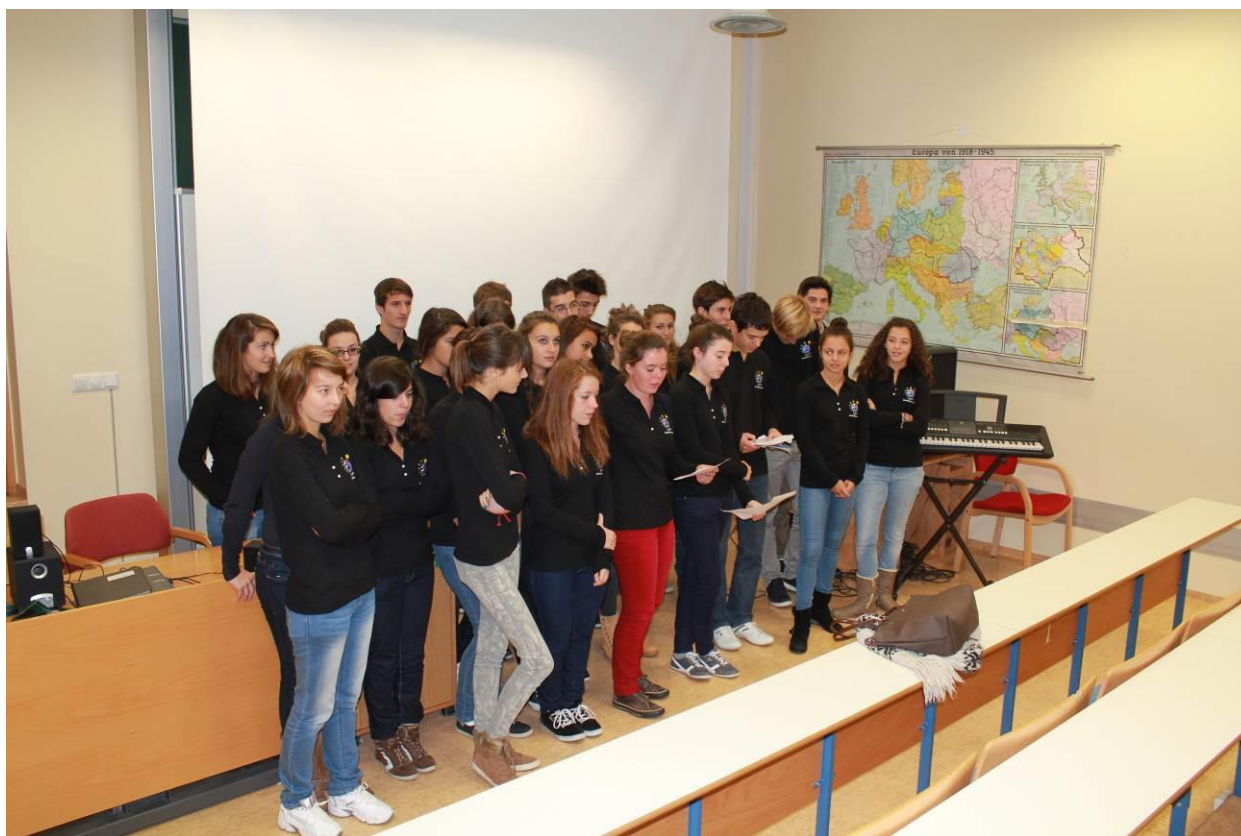
Nemendur frá St. Marie du Port kynna sig og sinn skóla.

Þann 8. nóvember komu meistaranemar í haf- og strandsvæðastjórnun hjá Háskólasetri Vestfjarða og voru með sérstaka kynningu á sér og verkefnum sínum fyrir nemendur. Þetta er liður í því að koma á samstarfi milli skólanna. Nemendur á þriðja og fjórða ári buðu svo meistaranámsnemum hjá Háskólasetri Vestfjarða í heimsókn til sín og kynntu fyrir þeim Vestfirðina í ensku máli og stuttmyndum. Kynningarnar voru hluti af sjálfstæðu rannsóknarverkefni sem nemendurnir hafa unnið að undanfarið.