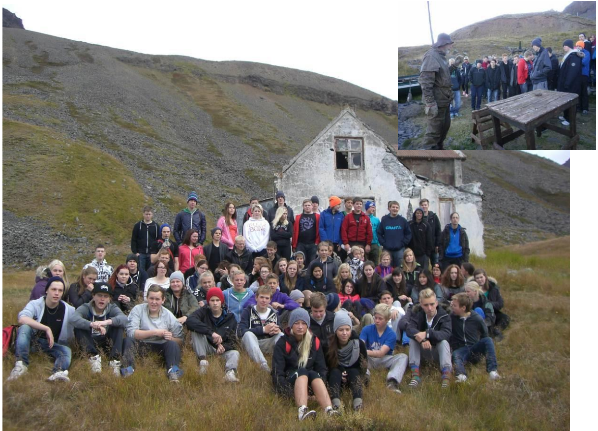
Nýnemar á Arnarnesi í nýnemaferð 30. ágúst.