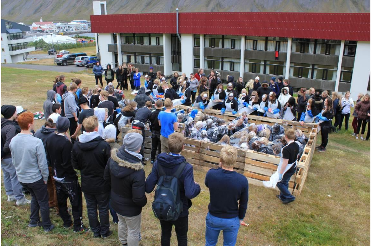
Innvígsluathöfn nýnema fór fram 29. ágúst.

Eins og áður þá fengu nýnemar sérstaka kynningu hjá umsjónarkennurum sínum og sérstaklega frá kennurum í lífsleikni. Að venju tóku eldri nemendur skólans á móti nýnemum með ýmsum uppákomum. Eftir að fjöldi nýnema og þar með húsnæði skólans hafði fengið óæskilegt lýsisbað á þriðjudegi voru nemendur sendir heim og eldri nemendur settir í að þrifa skólann. Innvígsluathöfn nýnema fór fram 29. ágúst og daginn eftir var hin árlega náms- og samskiptaferð nýnema með umsjónarkennurum og íþróttakennara.