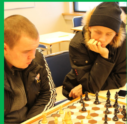
Tveir þungt hugsi yfir víkinga-skák.