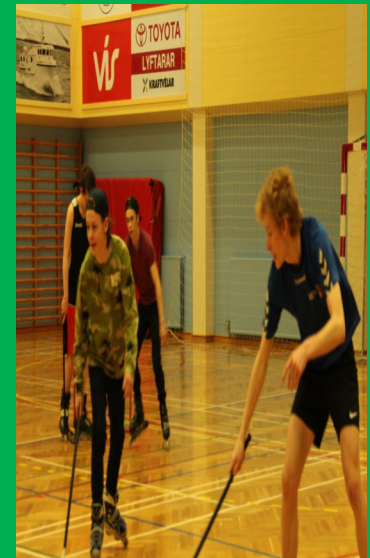
Sjáið þið snerpuna?

Hvers vegna er hún uppáhalds? Af því að það er svo mikið fjör henni alltaf hreint.