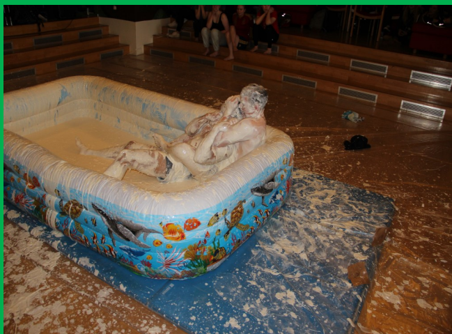
Slagur, slagur, skyrslagur....