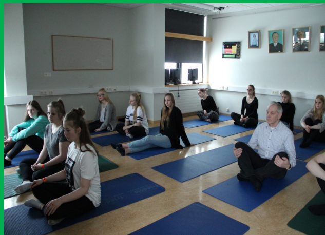
Nemendur og kennari slaka á í jóganu .