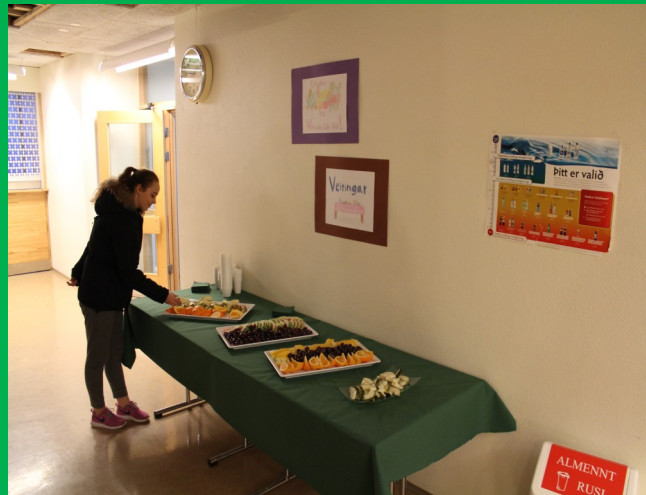
Hollustan í fyrirrúmi.